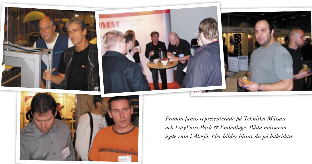
Fromm fanns representerade på Tekniska Mässan och EasyFairs Pack & Emballage. Båda mässorna ägde rum i Älvsjö. Fler bilder hittar du på baksidan.